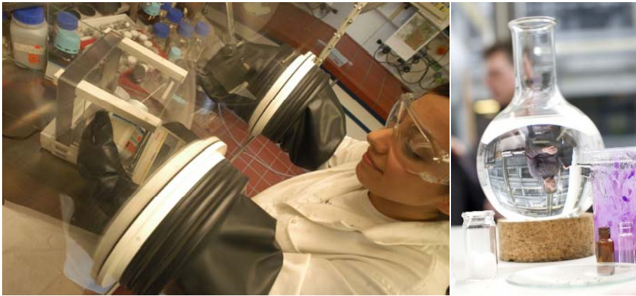
Fachbereich Chemie, Tag der Lehre 2016