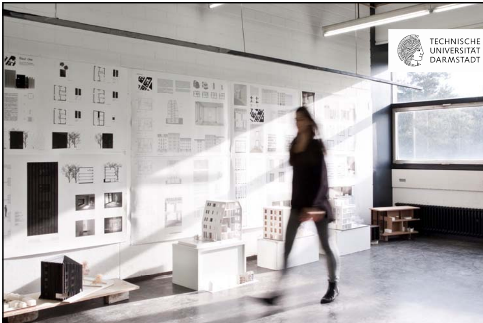
Fachbereich Architektur Tag der Lehre 2017